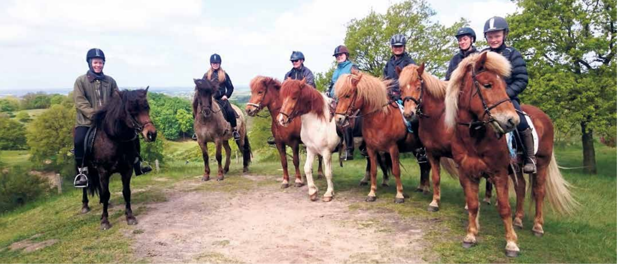
Sydfyns Riderute, der strækker sig gennem 75 kilometer smuk natur, går blandt andet gennem Svanninge Bakker.