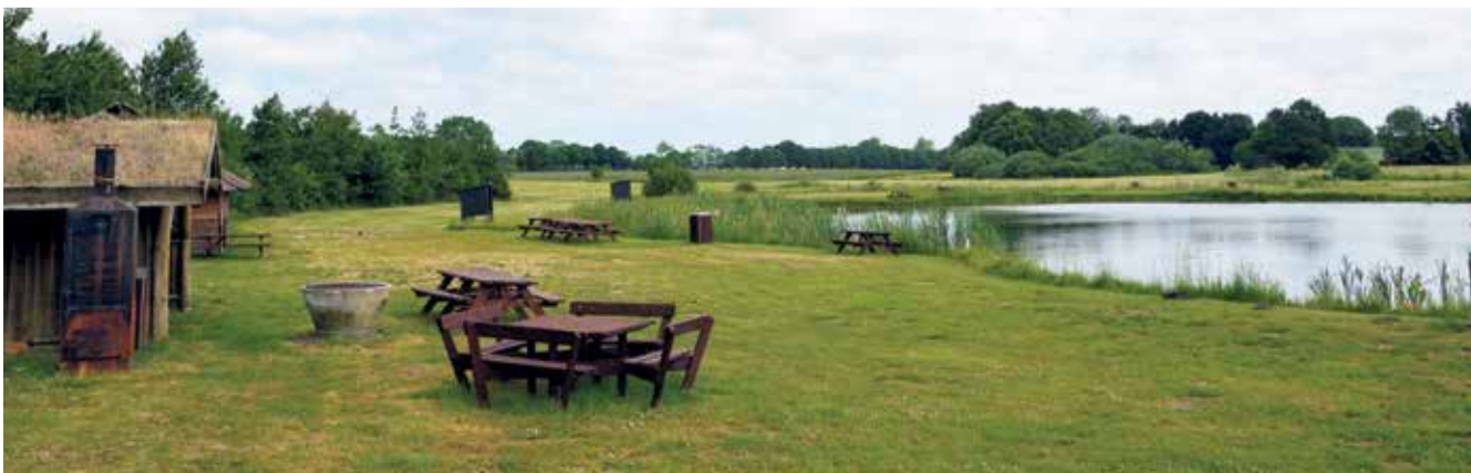
Udover turridding er der Put & Take søer og dertil hørende hytter og et campingområde på Højrupgaard.

Mod betaling har rytterne mulighed for dels at overnatte i hytte eller shelter, købe hø og plads på en fold til hestene, bade- og køkkenfaciliteter, samt købe sig til bagagetransport, så man ikke nødvendigvis skal ride rundt med oppakning til flere dage. ■